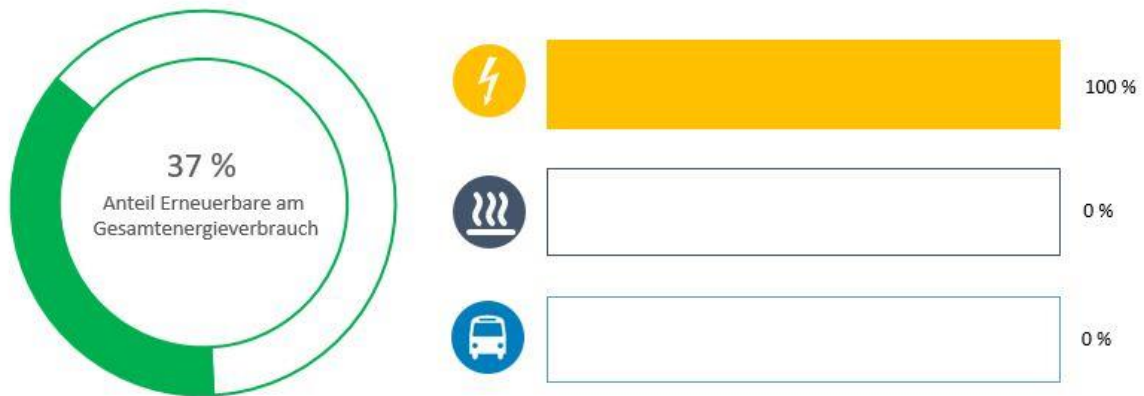
Abbildung 1: Anteil Erneuerbare am Gesamtenergieverbrauch