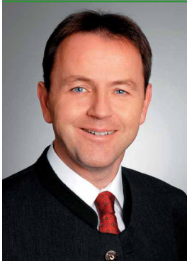
Niki Berlakovich Umweltminister